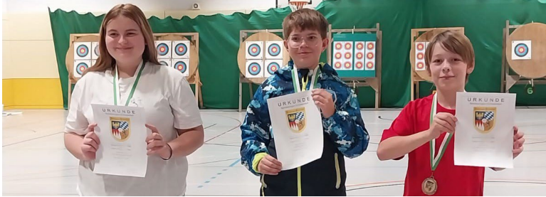
Unsere Schüler B bei der Siegerehrung

Am 4.5.25 hat erstmalig der 1. FC Geldersheim die Gaumeisterschaft ausgerichtet.